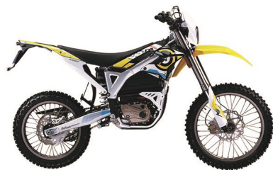
STORM BEE E