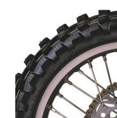
Off-road Zadné: 100/90-18