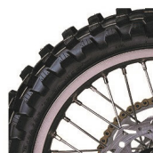
Off-road Zadné: 100/90-18