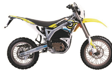
STORM BEE R