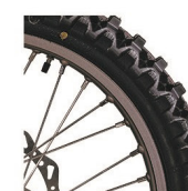
Off-road Predné: 80/100-21