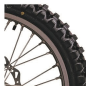
Off-road Predné: 80/100-21