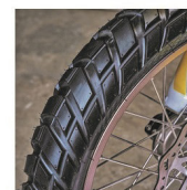
Pneumatika na všetky terény. Behúň prednej a zadnej pneumatiky je rovnaký Predné: 110/80-19 Zadné: 140/70-17